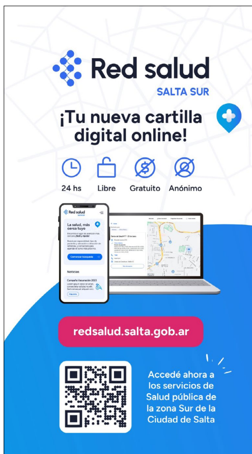
Figura 1 Flyer digital

Además en conjunto con el equipo del HPF y los CAPS definimos trabajar según el grado de complejidad de la institución de salud referente en cada área de Responsabilidad Sanitaria. Por esta razón para la difusión general, pensamos en incluir medios masivos de comunicación (radio, tv, medios impresos, redes sociales, etc). Además en las visitas domiciliarias que realizan los agentes sanitarios, los mismos son actores claves para la difusión. En aquellos casos en los que no hay agentes sanitarios, la difusión quedó a cargo del personal que realiza extensiones de cobertura por temas específicos. Por último, de manera más general, apuntamos a difundir la herramienta en la demanda presencial de turnos por ventanilla en cada centro de salud.