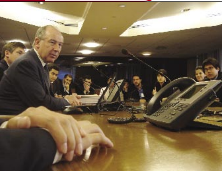
● A la izquierda, una clase con Rodrigo Rato, ex director del FMI. A la derecha, con José María Aznar, ex presidente de España.